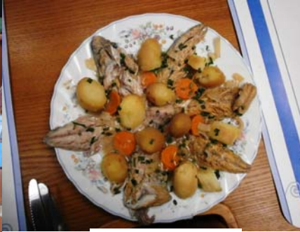
25 Juin , le beau temps continue, mais nous ne nous laissons pas intimider. Temps libre pour chacun. Il y a plein de choses à voir à Brest !