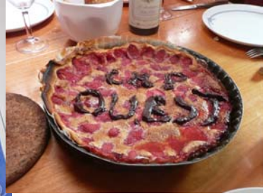
D'autres, délicats ou originaux