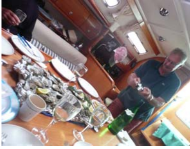
Certains mets étaient... renversants