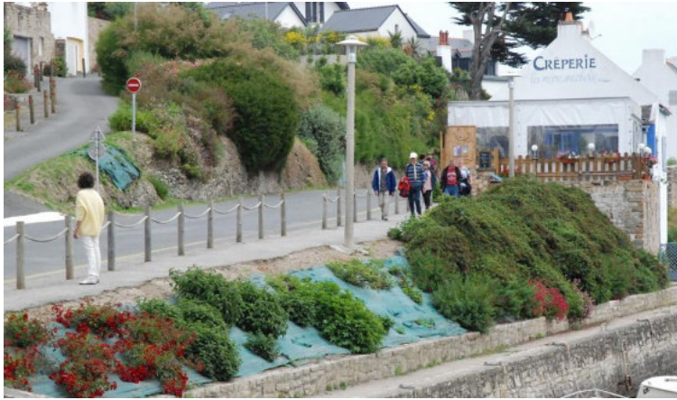
Descente en vers l'arrêt de bus

Dimanche 14 , visite guidée de la citadelle du Palais. Après un rapide déjeuner, départ en car pour Le Palais, où nous retrouvons "George" de l'ANPLF et son équipage au bassin à flot (inscrit pour la visite et le resto) qui n'ont pas pu venir à Sauzon, le tirant d'eau de 2m étant un handicap