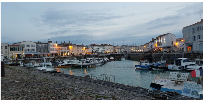
Figure 5 - Le port et le village

Le port est beau à voir de jour, mais également en soirée.