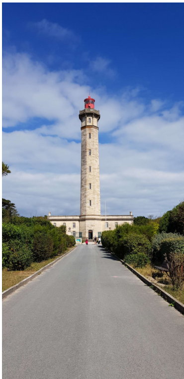
Figure 11 - Le Phare des Baleines

En quittant l'île de Ré, certains équipages de Biloup ont dû voir le Phare des Baleines.