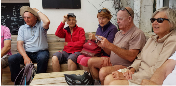
Figure 9 - Chapeau au Président pour l'organisation.

Armelle et moi, avons beaucoup aimé la balade à vélo jusqu'à l'ancienne abbaye des Châteliers à la Flotte.