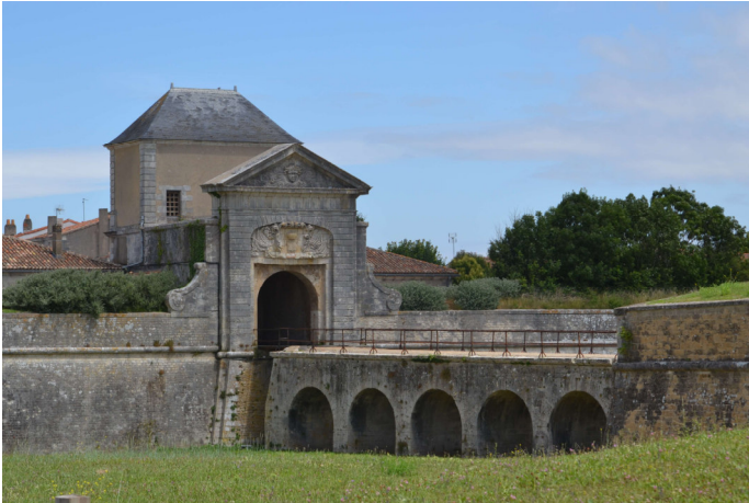
Figure 6 une des portes d'entrée dans la ville