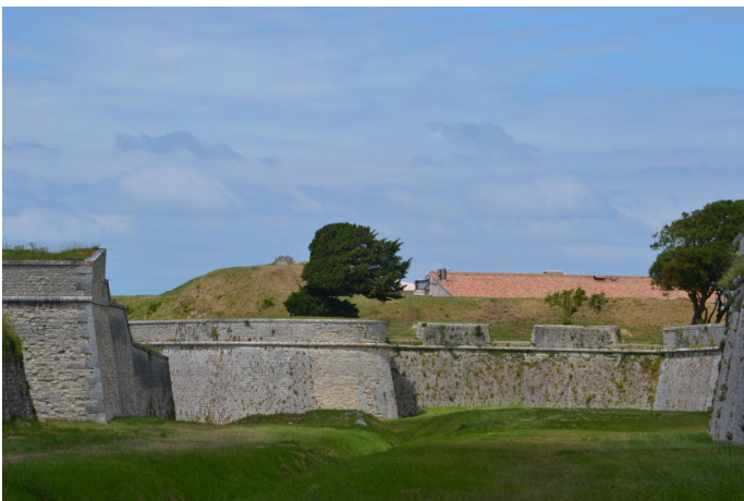
Figure 7 - Les murs cachent la ville.