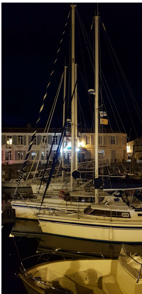
Figure 3 – La proue du 36 qui dépasse.

Il y a des gros Biloup et des plus petits.