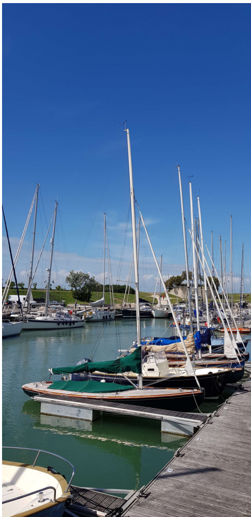
Figure 1 - Tofinou

Dans le Port de Saint-Martin-en-Ré, il y a pas mal d'élégants Tofinou.