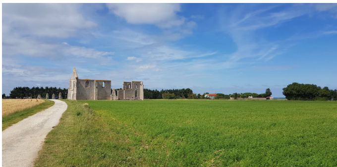
Figure 10 - Ancienne abbaye des Châteliers

Armelle et moi, avons beaucoup aimé la balade à vélo jusqu'à l'ancienne abbaye des Châteliers à la Flotte.