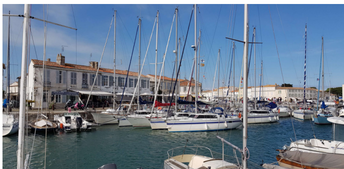
Figure 2 - Les Biloup regroupé au fond du port

C'était plaisant de voir les Biloup regroupés dans le fond du port à flots.