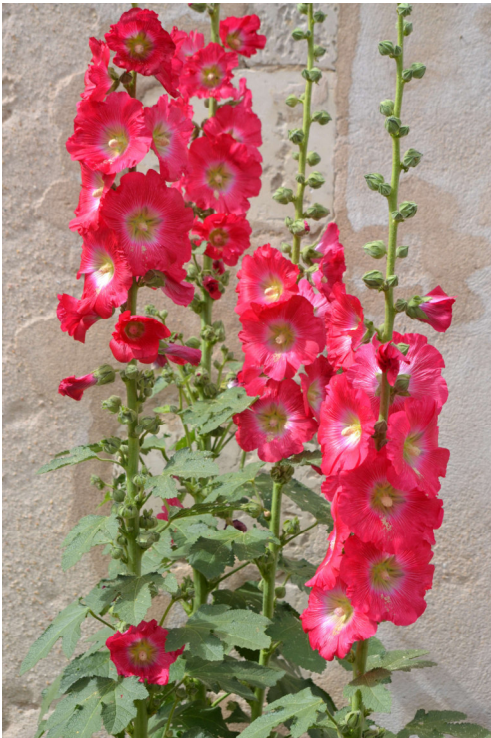
Figure 4 - Roses trémières

Partout, l'île de Ré est fleurie par les roses trémières.